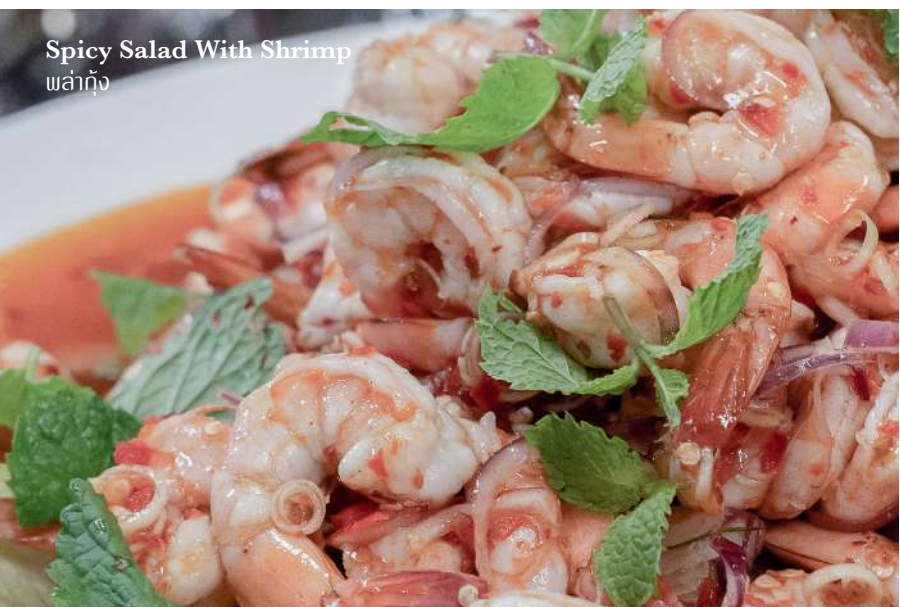
Spicy Salad With Shrimp พล่ากุ้ง