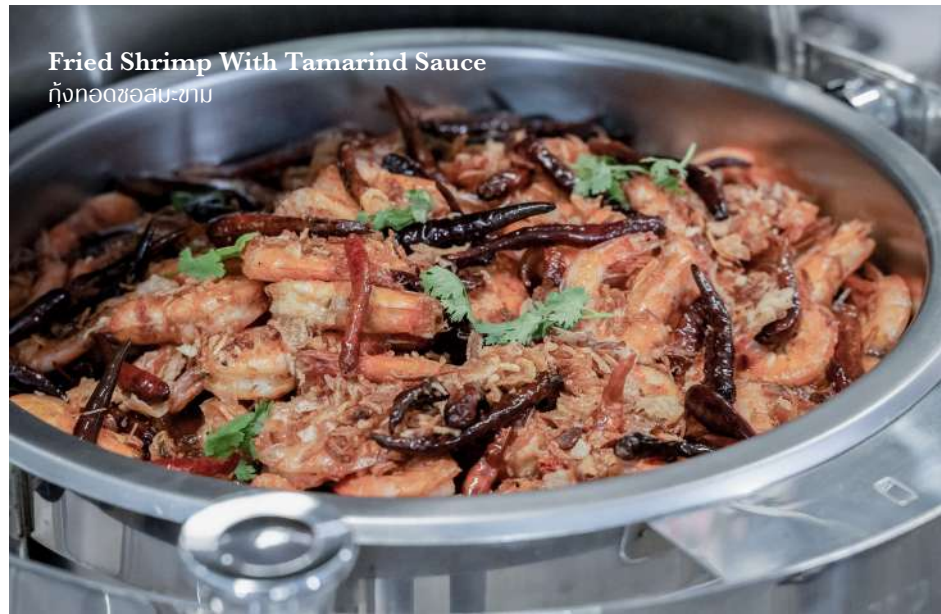
Fried Shrimp With Tamarind Sauce กุ้งทอดซอสสม-ซาม