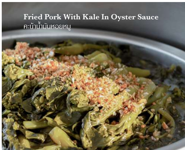
Fried Pork With Kale In Oyster Sauce คะน้าหมูผัดหอยทู