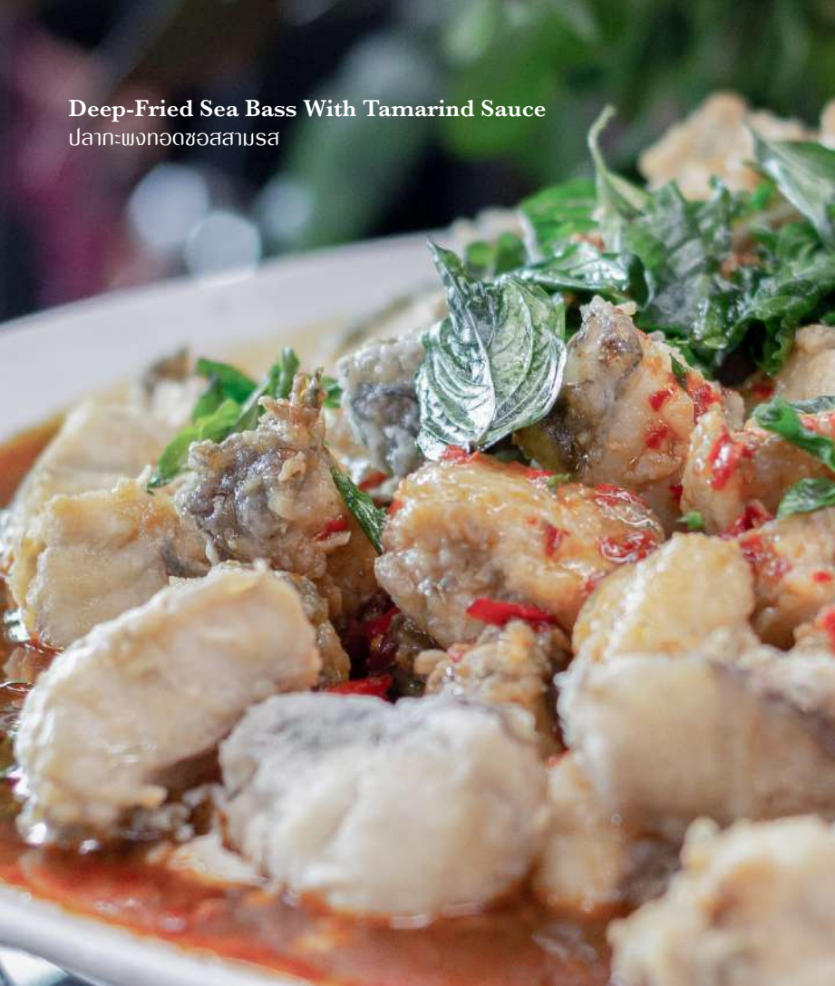
Deep-Fried Sea Bass With Tamarind Sauce ปลาทะเลทอดซอสสามรส