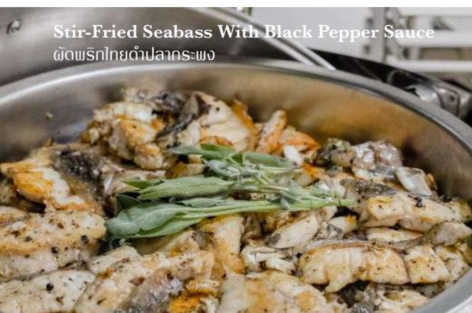
Stir-Fried Seabass With Black Pepper Sauce ผัดพริกไทยดำปลากระพง