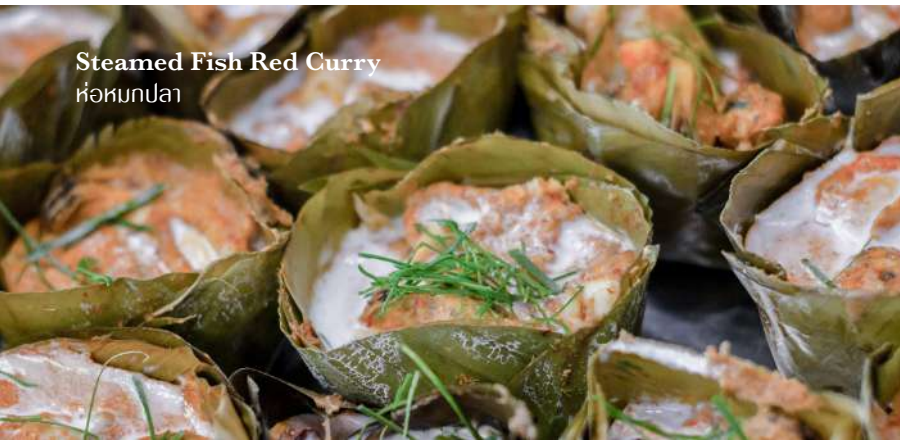
Steamed Fish Red Curry ห่อหมกปลา