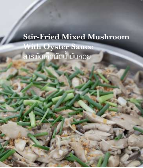
Stir-Fried Mixed Mushroom With Oyster Sauce สารพัดเห็ดผัดน้ำมันหอย