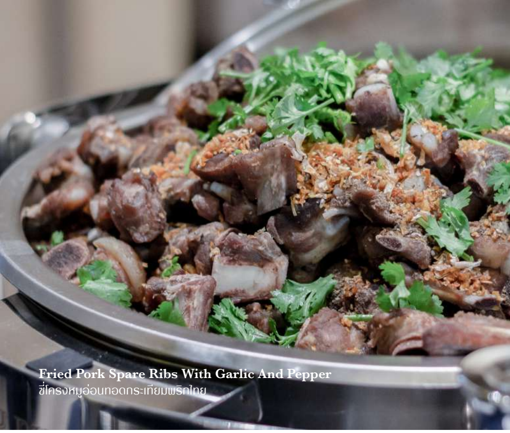
Fried Pork Spare Ribs With Garlic And Pepper ซี่โครงหมูอ่อนทอดกระเทียมพริกไทย