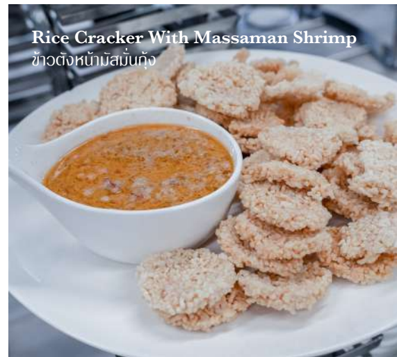
Rice Cracker With Massaman Shrimp ข้าวตังหมักมีสมันกุ้ง