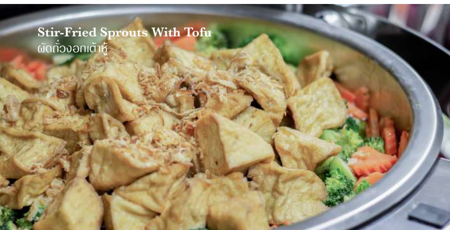
Stir-Fried Sprouts With Tofu ผัดถั่วงอกเต้าหู้