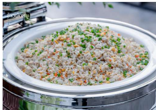
ข้าวผัดหมู