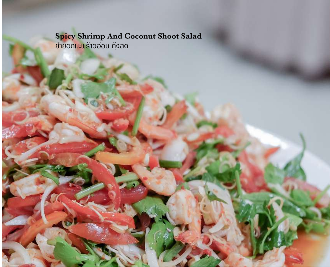
Spicy Shrimp And Coconut Shoot Salad ยำยอดมะพร้าวอ่อน กุ้งสด