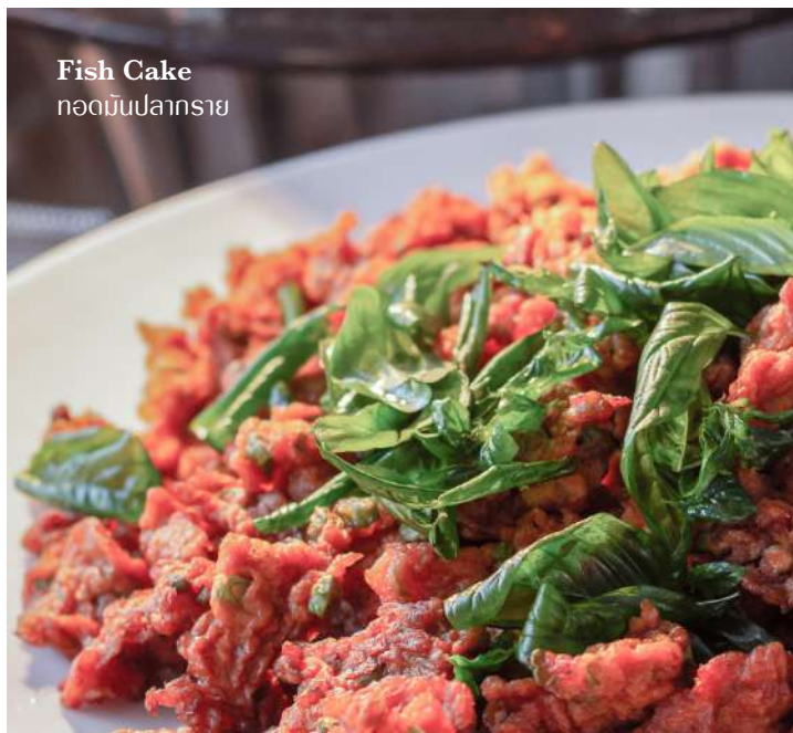
Fish Cake ทอดมันปลาทราย