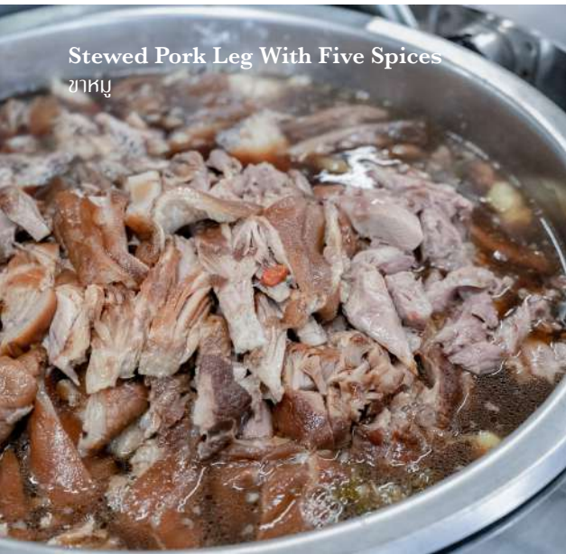
Stewed Pork Leg With Five Spices ขาหมู