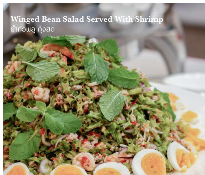
Winged Bean Salad Served With Shrimp ยำถั่วงอก กุ้งสด