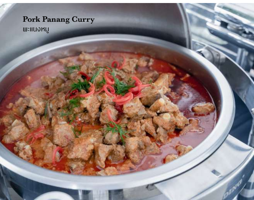
Pork Panang Curry พะแนงหมู