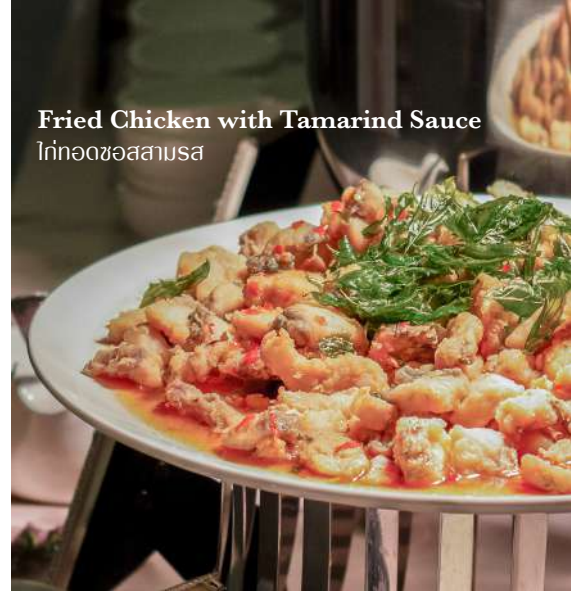
Fried Chicken with Tamarind Sauce ไก่ทอดซอสตามูสา